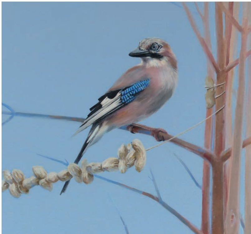
Expositie Gonny van den Nouwelant

In maart richtte de Amateur Fotografen Vereniging Vlaardingen een fototentoonstelling in die in het teken stond van de Geuzenmaand. Met het oog op het vijftien-jarig bestaan nodigden wij bezoekers en vrijwilligers van De Windwijzer uit om creaties in te zenden met als thema 'Hier mag je zijn'. In september vond een tentoonstelling plaats van de ingezonden kunstwerken, aangevuld met foto's van de oorspronkelijke verbouwing in 2010.